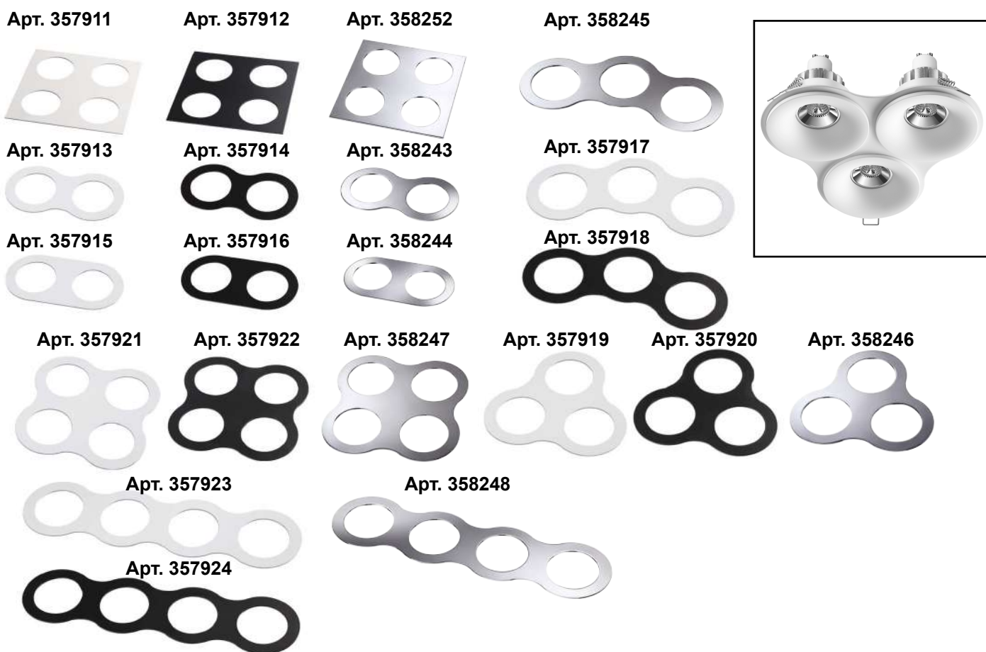
Схема установки встраиваемого светильника.